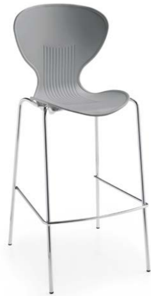
FLASH 160 4 LEG STOOL