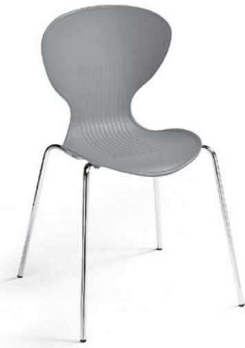
FLASH 160 4 LEGS

FLASH LOOKS GREAT AND IS PRACTICAL TO USE WITH ITS BRIGHT ORIGINAL COLOURS