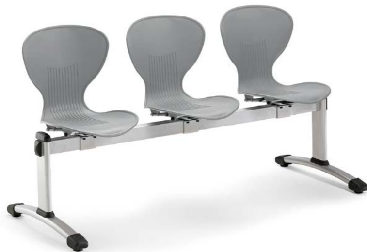
FLASH 160 ON 500 BENCH