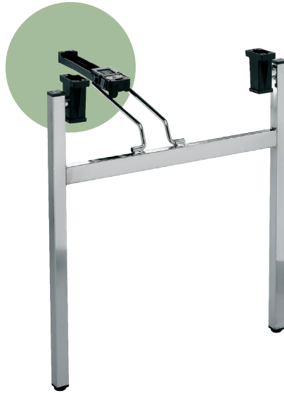
bloccaggio in plastica plastic leg locks