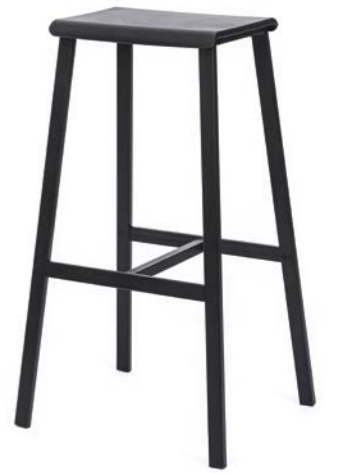
BLACK PAINTED FRAME, BLACK PLASTIC SEAT