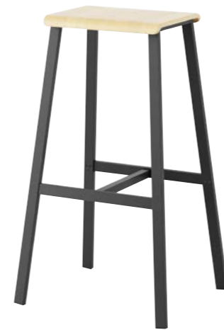
BLACK PAINTED FRAME, NATURAL BEECH SEAT