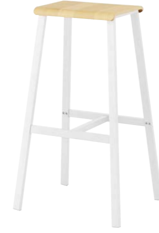
WHITE PAINTED FRAME, NATURAL BEECH SEAT