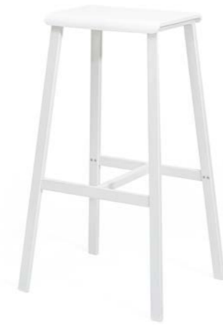
WHITE PAINTED FRAME, WHITE PLASTIC SEAT

FROM THE KNOCK DOWN LOGIC COMES A UNIQUE STOOL: KD STOOL IS EASY TO ASSEMBLE, TAKING UP LITTLE SPACE DURING TRANSPORT.