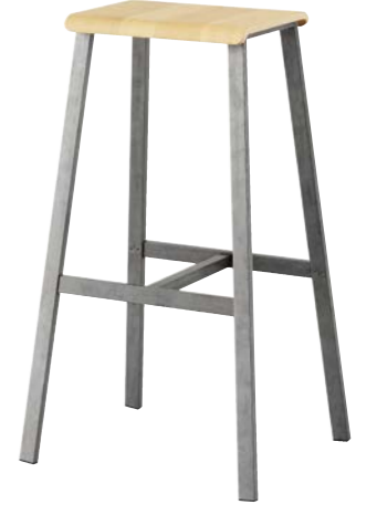
RAW FINISHING, TRANSPARENT MATT PAINTED FRAME, NATURAL BEECH SEAT