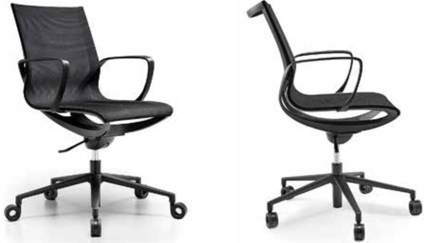
ZERO-G SWIVEL WITH CASTORS AND ARMRESTS