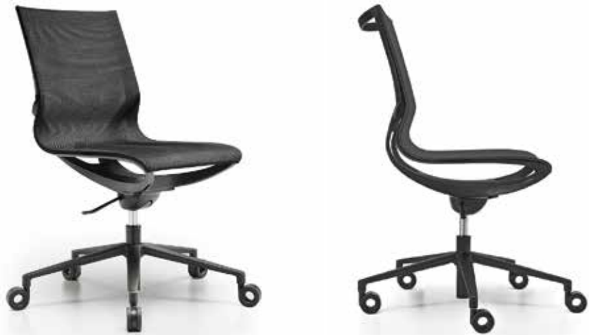
ZERO-G SWIVEL WITH CASTORS