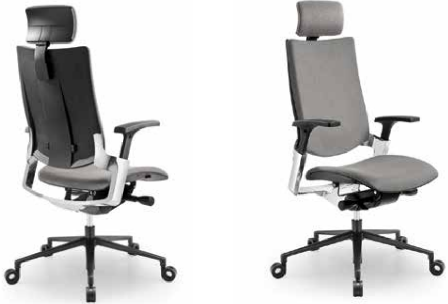
INTEGRA WITH HEADREST FOR UPHOLSTERY