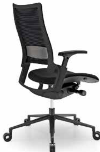
INTEGRA WITH MESH BACKREST